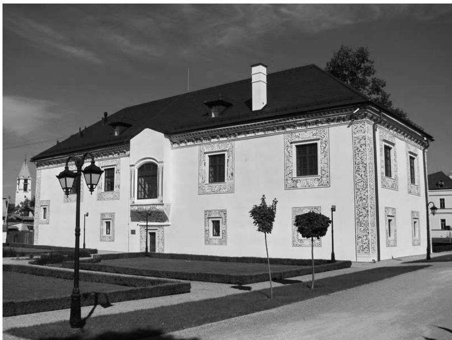
Sobášny palác v Bytči

mek s tzv. Sobášným palácem, vzácnou a ojedinělou renesanční stavbou. Protože byl ale celý komplex roku 1856 vážně poškozen požárem, nechal jej nový majitel opravit. Podporoval také své souvěrce ve městě a okolí a v Bytči nechal vystavět židovskou školu. Zemřel v březnu 1886 v San Remu. Pohřben byl v neoklasicistní hrobce, jíž si nechal vystavět na židovském hřbitově v Hliníku nad Váhom.[10]