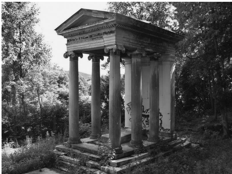
Rodová hrobka na židovském hřbitově v Hliníku nad Váhom